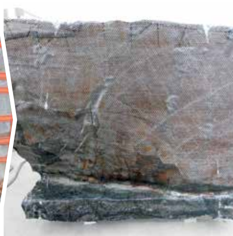
BLOCCO RISANATO IN SV