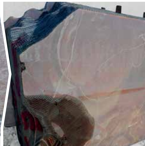
100% LASTRE RECUPERATE