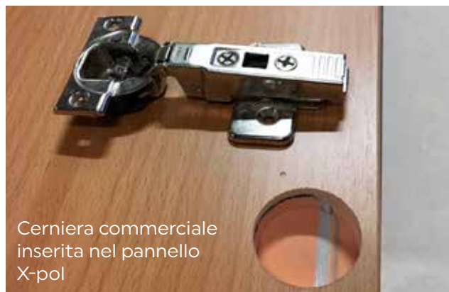
Cerniera commerciale inserita nel pannello X-pol