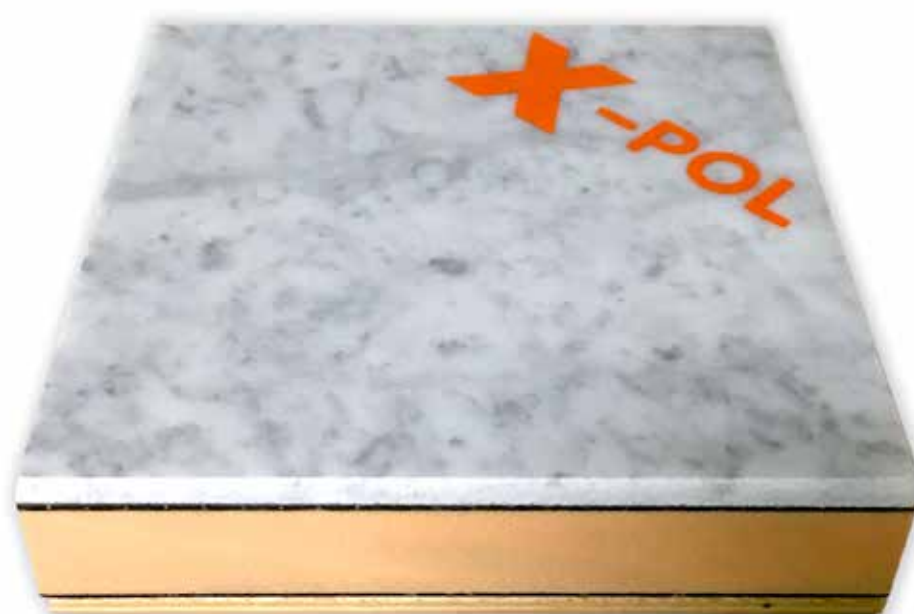
SEZIONE DI ANTA CUCINA

* Essendo la schiuma del pannello limitata a dimensione standard, su lastre con dimensioni diverse o maggiori sarà effettuato taglio e giunzione della schiuma, all'interno della fibra di vetro, sopra e sotto il pannello rimarrà un pezzo unico: questo per assicurare continuità e compattezza al pannello anche di grandi dimensioni.