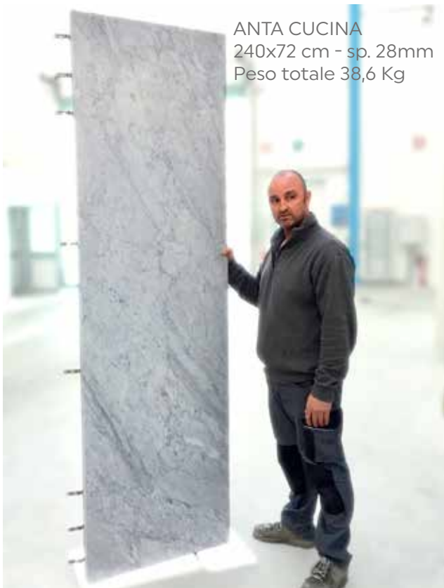
ANTA CUCINA 240x72 cm - sp. 28mm Peso totale 38,6 Kg